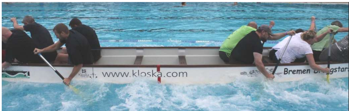
Zwei Teams in einem Boot